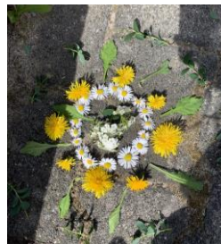
Mandala von Finja Jetzer