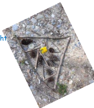
Mandala von Timo Ripken